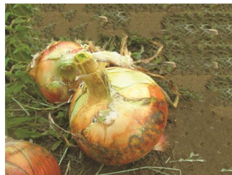
(山梨県大月市産新玉ねぎ)

「みずみずしく、柔らかくて美味しい」とお客様から毎年ご好評をいただいている大月の新玉ねぎが特産品になり、地域活性化に貢献できるようにこれからも取り組んでいきます。