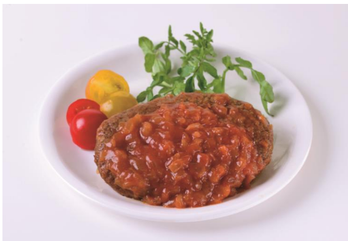
(山梨県大月市産新玉ねぎを使ったハンバーグ オニオントマトソース 盛り付け例)