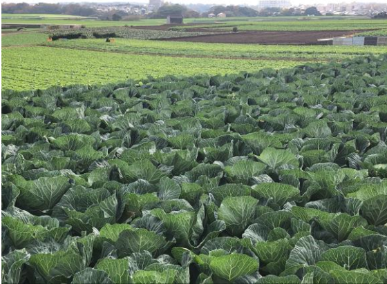
(三浦市のキャベツ畑)