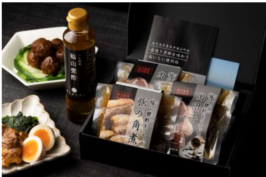
鹿児島 壺造り黒酢を味わうセット