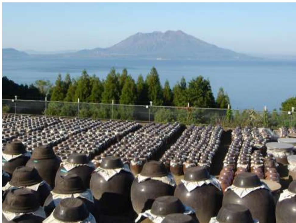
鹿児島黒酢・甕酢畑風景

石井食品では、これまでもその土地々々の気候や風土、生産者の想いや工夫を知り把握することが調理の原点と考えてきました。一つひとつの食材を国内屈指の産地に赴いて状況や品質を確認し厳選しており、今回、重久盛一酢醸造場の「福山甕酢」とも出会うことができました。世界でも珍しい製法を長きにわたり継承し、鹿児島県霧島市福山町に誇る大事な名産品である「福山甕酢」は、手間ひまをかけることでしか作ることができません。そのため、この現代においてかめつば露天醸造法を続けていくことは、貴重であるとされています。