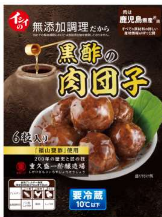
黒酢の肉団子パッケージ