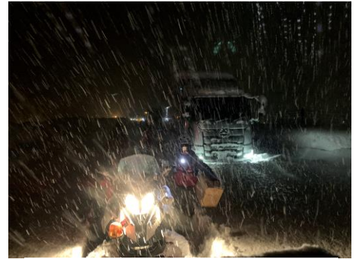
日本笑顔プロジェクトによる支援の様子

2020年12月16日ごろから発生した新潟、群馬県境付近の関越自動車道での大雪による立ち往生はまだ記憶に新しく、石井食品では日本笑顔プロジェクトを通じて非常食の提供を行いました。その際ほとんどの車内に食料を備えていなかったことを知り、自宅だけでなく車内にも非常食を備蓄しておくことの重要性にたどりつきました。1月以降も新潟県や富山県などで記録的な降雪により、渋滞と立ち往生が発生しています。また現在のコロナ禍では避難所に密集しないよう分散避難が推奨され、車中泊の選択が増加することが予想されます。そのため新しい非常食セットの発案が急務であると考え、日本笑顔プロジェクトと共同開発を行い着想から約1ヶ月で今回のセットのトライアル販売にいたしました。