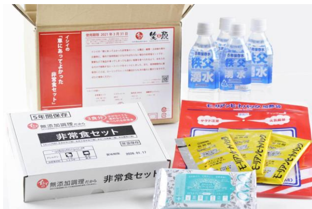
「車にあってよかった非常食セット」