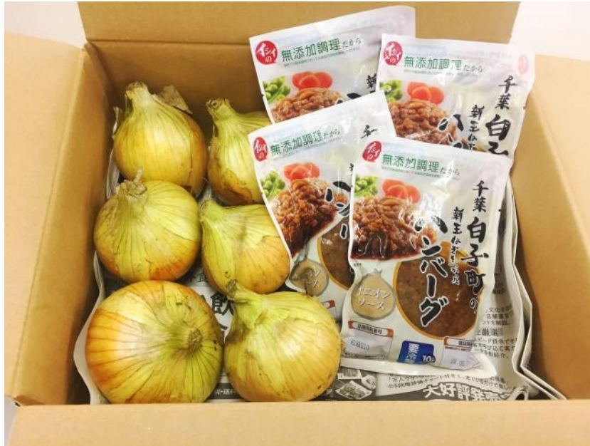
(白子玉ねぎとハンバーグセットお届け見本)

※玉ねぎの生育状況・天候により、前後する可能性があります。また、数に季節の作物につき数に限りがあります。予めご容赦ください。