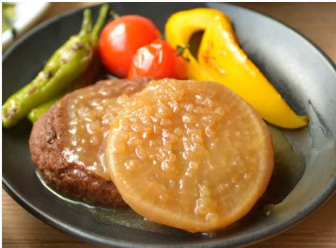
北杜市・明野町で育った大根のうま煮と食べるハンバーグ～甘辛おろしソース～