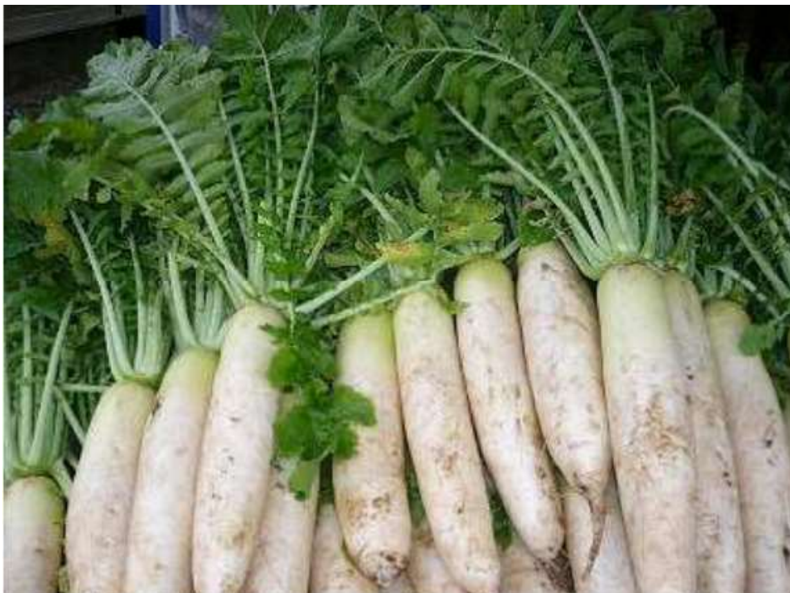
北杜市明野町で育っただいこん

石井食品では、大月市産の玉ねぎのはじめ、山梨県との取り組みをこれまでも積極的に進めてまいりました。その山梨県を代表するスーパーであるオギノと地域食材を使った旬の商品をプロデュースする石井食品の「地域食材を使って地元を元気にしたい」という思いが重なり、この度開発がスタートいたしました。地元生産者とのつながりが深いオギノとの取り組みであったからこそ「北杜市明野町のだいこん」と出会うことができました。北杜市明野町の秋だいこんの歴史は古く、江戸時代からソバと共に栽培されていたと言われています。明野町の火山灰土に適した作物として栽培され、恵まれた土壌条件から産出されるこの地域のだいこんは、高品質なことでも有名です（参考文献：山梨県 HP、山梨の特産・伝統野菜より）。この度、共同開発のパートナー、オギノの食材の目利きであるバイヤーがおいしいと断言する品質を誇った、この時期イチオシのだいこんです。今後もこの取り組みを通じて、山梨県内の地産地消の推進と地域経済の振興を目指してまいります。