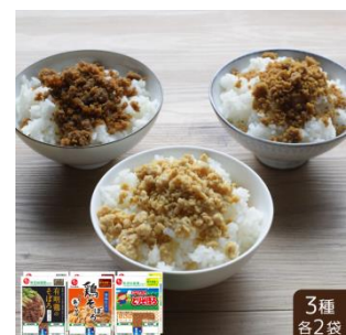
3種そぼろ食べ比べセット

石井食品の公式オンラインストア無添加調理専門店「イシイのオンラインストア ( https://shop.directishii.net/ )」では「ごろっとあらびき鶏そぼろ 旨塩仕立て」と「おべんとクン とりそぼろ」、「有明鶏のそぼろ ごぼう入り」がそれぞれ2袋ずつ入った6袋の「3種そぼろ食べ比べセット (818円税込・送料別)」を4月11日から発売します。また「ごろっとあらびき鶏そぼろ 旨塩仕立て」の5袋セット (755円税込・送料別) も同時に発売します。